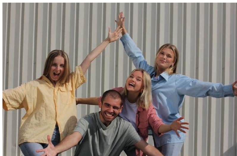
Scen Kivik anordnar ett musikalläger för barn.